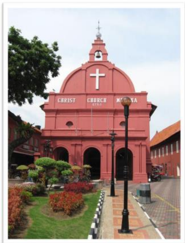
Малайзия: Церковь Христа – Малакка