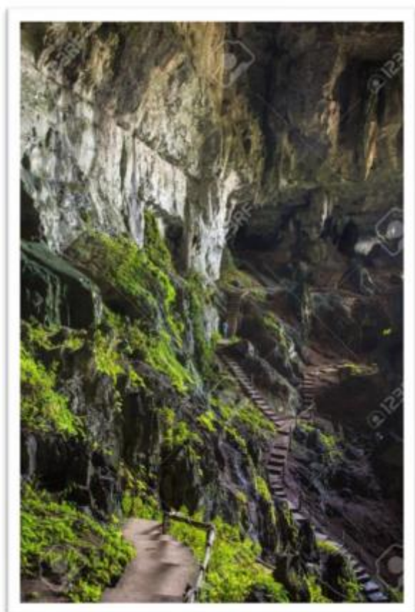
Малайзия: Пещеры Гуа-Пари-Пари – Саравак