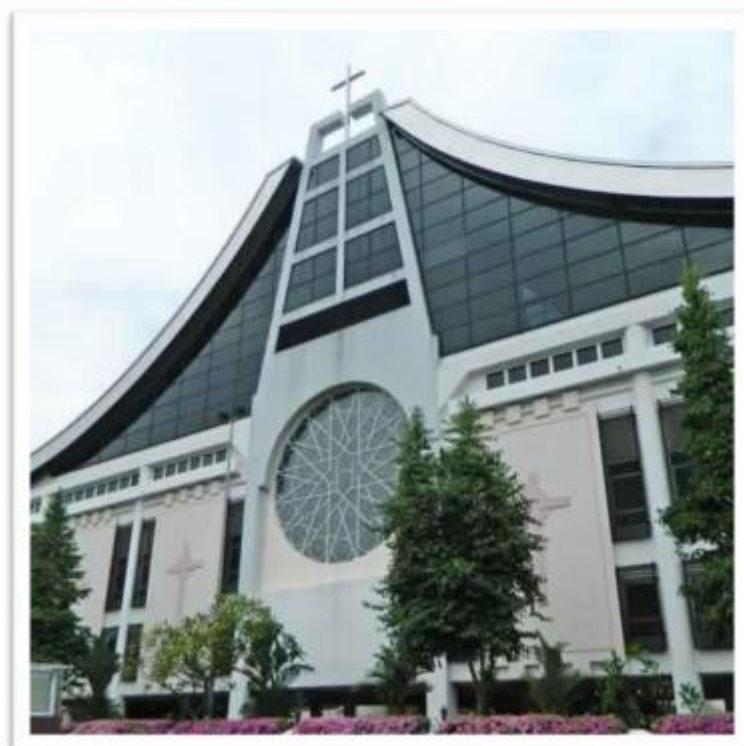
Сингапур : Церковь Святого Семейства

ОТЧЁТ ОБ ОПЫТЕ РАБОТЫ ВО ВРЕМЯ БИОЛОКАЦИИ.