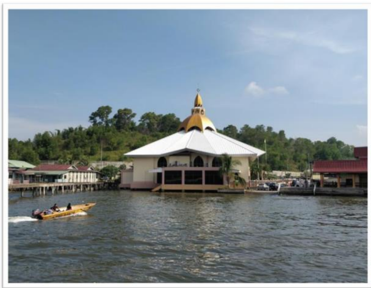
Бруней: Мечеть Аль-Мухтади Биллах - кампонг Айер

Мы собираемся в мечети Аль-Мухтади Биллах в кампонг Айер в Брунее