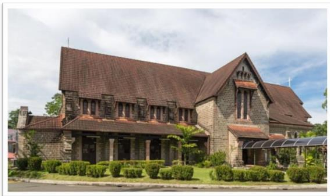
Малайзия: Приход Святого Михаила и Всех Ангелов – Сандакан; Сабах