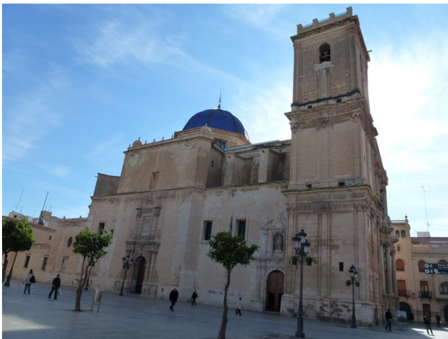
Basilica de Santa Maria.