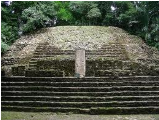
Maya ruïnes van Lamanai: de kleine tempel met stellae n°9 die gewijd was aan een Maya priester die een connectie had met een Hoge Regeerder van het Aardse hoofdkwartier rond 650 n.C.

Er waren dynastieën onder de Maya's, grote koningen en hoge priesters die zeer bekwaam waren, met wie wij konden communiceren en onze kennis overdragen.