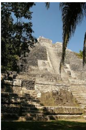
Ruïnes van Lamanai: De hoogste heilige tempel waar we een kleine meditatie deden met 3 Maya's. Het is hier dat Monsanloran probeerde te communiceren met ons voor de eerste keer... maar ik begreep toen alleen "Ik ben M....." ...Ik vroeg aan de Maya-jongen wat hij had doorgekregen, maar hij had alleen begrepen dat Hogere Wezens iets over hun verleden probeerden te vertellen. Wat juist kon hij niet zeggen. Het is later dat wij zijn naam via een andere persoon hebben doorgekregen).