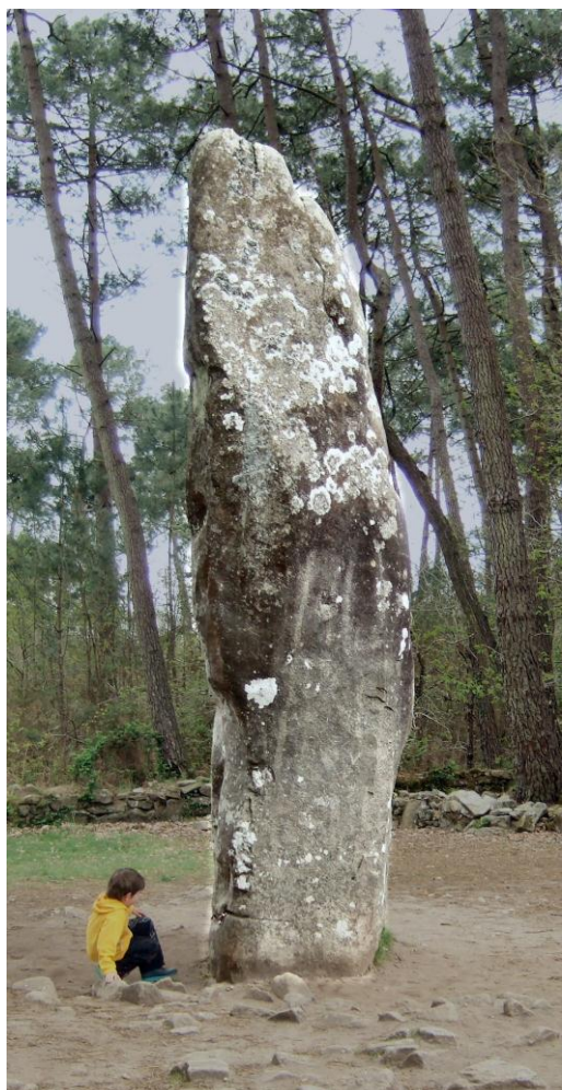
Geant du Manio Carnac.

Vous pouvez également créer une Ancre de Lumière Merkabah chez la personne où vous logerez à l'endroit où il se sentira le mieux pour méditer autour si tel est son désir.