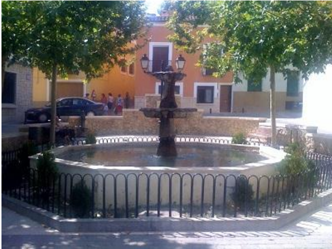
Huete Ancre de Lumière.

Vous pouvez également créer une Ancre sur la place centrale de la ville et l'utiliser comme les autres.