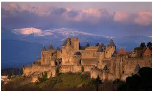
Le vieux Carcassonne.