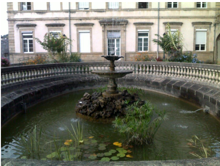
Fontaine derrière Hôtel de

2) Il faut trouver l'endroit où vous devez recupérer des données et ça sera un peu plus difficile. Nous devons essayer de vous guider sur place mais cela se trouve au centre-ville. Faites encore quelques recherches et si vous ne trouvez pas nous vous guiderons sur place. Lorsque vous aurez trouvé l'endroit, vous vous mettrez si possible en cercle et vous allez en méditation jusqu' à ce que les données vous auront été transmises et que vous les aurez emmagasinées. Nous essayons de montrer à la petite un genre de monument en cercle, une ancienne fontaine où les gens venaient s'abreuvoir dans les anciens temps. Il y avait une ancienne source là et probablement il y aura encore des indications que cet endroit est béni ou que cette eau est bénite. Vous trouverez sur place, on vous guidera. (Note Kathy Février 2014 : c'était derrière l'Hôtel de Ville de Tulle où il y a un parc. Ils ont dû nous diriger.)