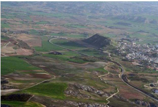
Datenabruf fast auf dem höchsten Berg

Ihr könnt auch einen Anker auf dem zentralen Platz der Stadt erstellen und ihn verwenden wie die anderen.