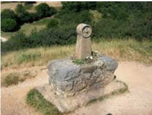
Kleines Denkmal mit Lichtanker