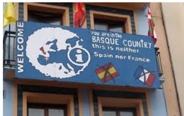
Büro des baskischen Separatismus