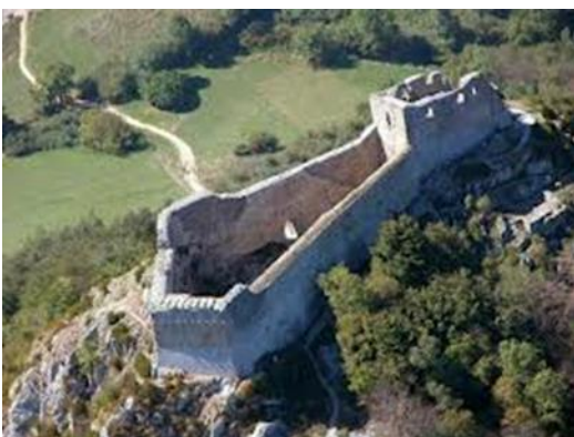
Schloss von Montsegur

Ihr werdet dorthin gehen, wo sich ein kleines Denkmal mit einem Pfahl befindet, welches daran erinnert, dass dort 250 Katharer lebendig verbrannt