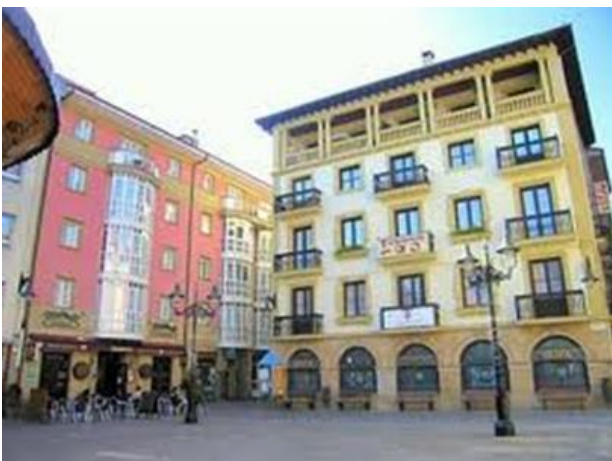
Hotel in Zarautz

Plötzlich kamen zwei Leute zu uns und fragten, wonach wir suchten und da es schon spät war, fragten wir sie, wo es Hotels in der Nähe des Meeres gibt. Sie sagten uns, wir sollten weiter nach Zarautz fahren, lediglich noch 10 Autominuten von dort entfernt - nur ein bisschen weiter, wie zufällig. Schlussendlich fanden wir ein Hotel für 5 Personen in Zarautz um einen Platz mit einem Kiosk. Am nächsten Tag sah ich das große Schild an einem Haus rund um diesen Platz: „Sie sind im Baskenland, das ist weder Spanien noch Frankreich "mit ihrem politischen Büro im ersten Stock. Den Himmlischen gelang es, uns genau dort zu haben, wo wir sein mussten ... unglaublich, aber wahr.